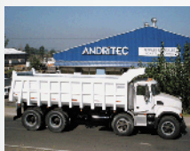
Tolvas Sobre Camión