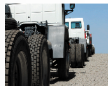
Modificación de Camiones