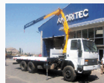
Grúas Articuladas Sobre Camión